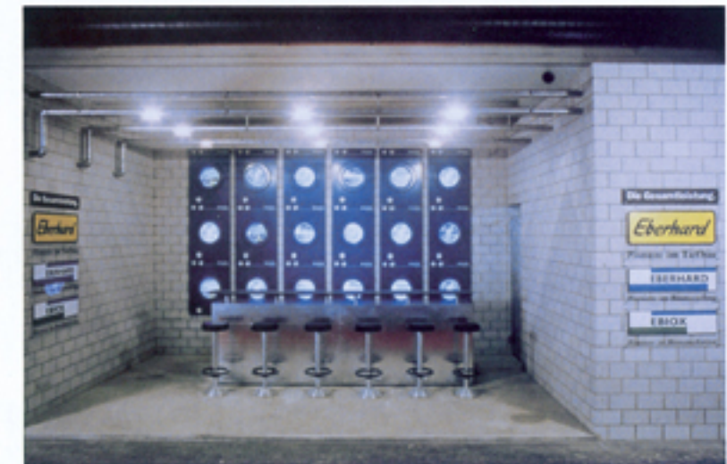
Die Altlastsanierung wurde visuell in eine Installation übersetzt, die den Waschvorgang in einer Großwaschanlage modellartig in einen Waschsalon verlegt.

Konzept | Das Unternehmen ist in der Schweiz Marktführer auf dem Sektor der Altlastsanierung und bietet Konzepte zur Wiederaufbereitung von kontaminierten Boden- und Baumaterialien an. Zu ihren Kunden zählen Bauunternehmen, Mulden-transportfirmen, die Öffentliche Hand, Bahnen und Privatfirmen. Mit einem ungewöhnlichen Auftritt wollte das Unternehmen nicht Leistungen und Konzepte auf der Messe vorstellen, sondern durch eine verblüffende Idee auf seine Stellung im Markt aufmerksam machen. »Wir sind Pioniere in der Altlastsanierung«.