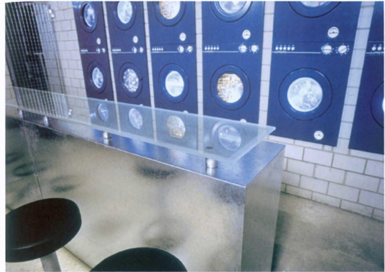
Bar aus verzinktem Industrieblech mit Glasabdeckung.